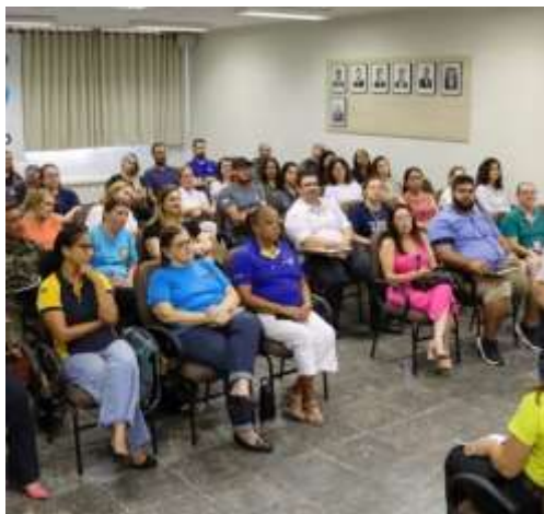
Representantes de empresas e instituições