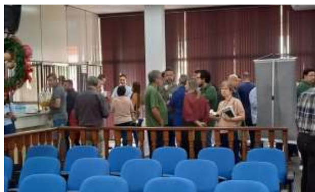
Participantes da plenária