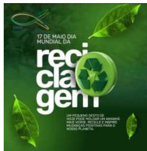
Postagens realizadas nos dias mundiais da Educação Ambiental e Dia da Reciclagem