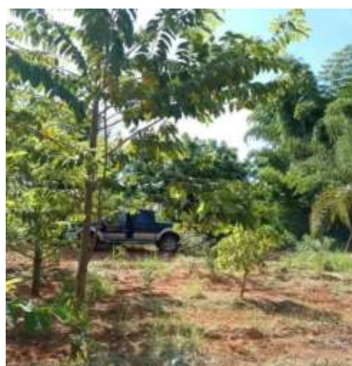
Registro do desenvolvimento dos indivíduos