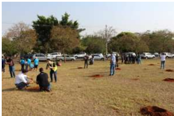
Berços abertos para receber as mudas