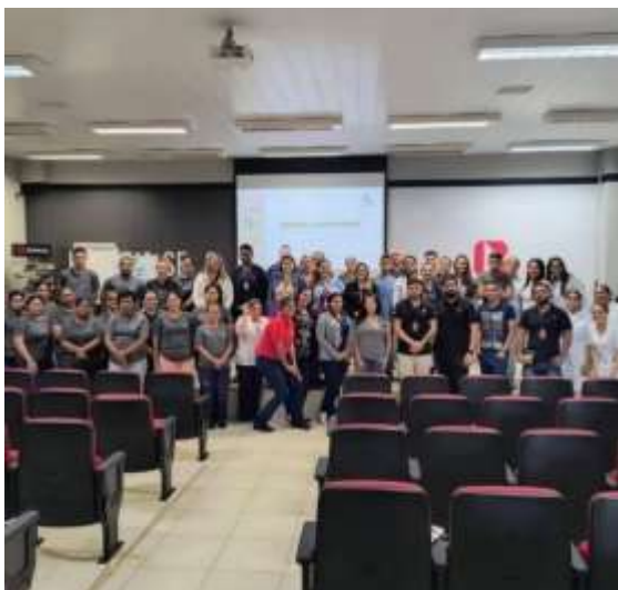
Colaboradores da Bracol após palestra