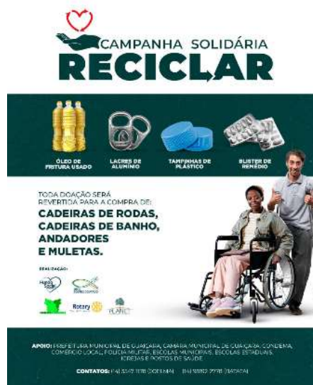
Panfleto da campanha