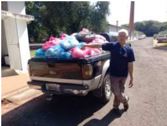
Doação recebida do hospital Clemente Ferreira