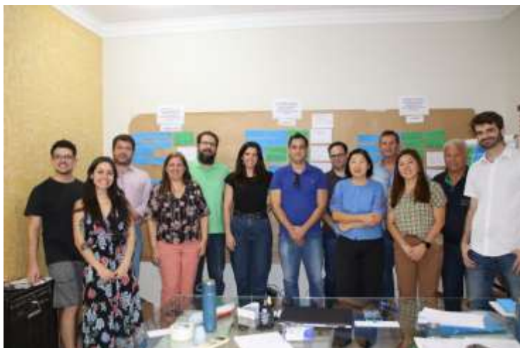
Participantes da oficina de planejamento do Capacita – SIGRH 2025