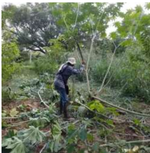
Extração de espécies invasoras