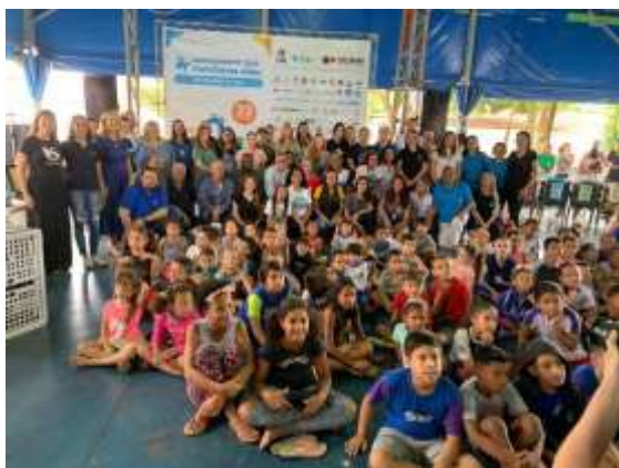
Visão geral do público