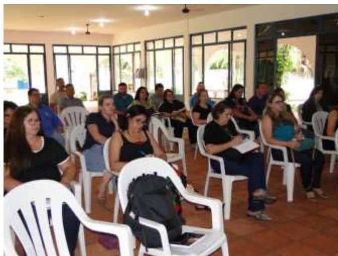
Participantes da reunião