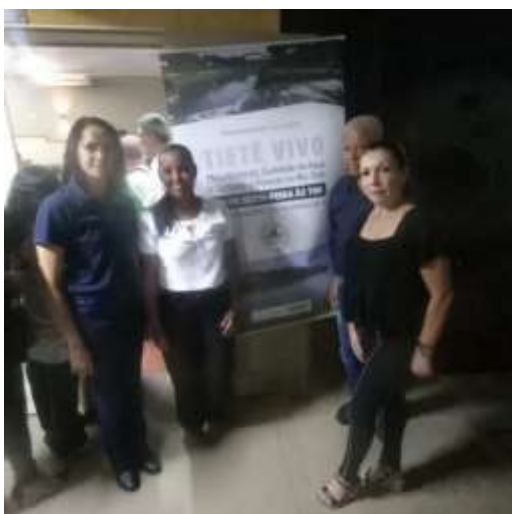
Representantes da ONG SOS Rio Dourado