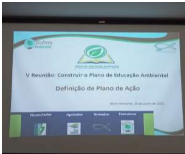
Tema da V Reunião: Definição do plano de ação