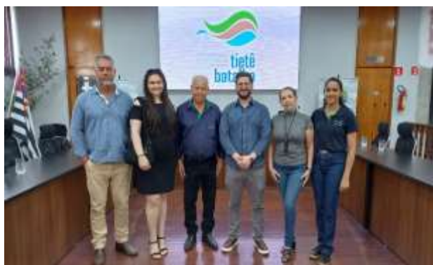
Voluntários da ONG e Unilins no CBH-TB