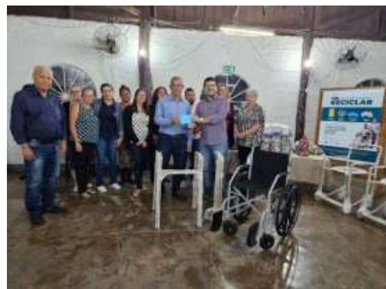
Entrega oficial dos equipamentos ao Fundo de Solidariedade