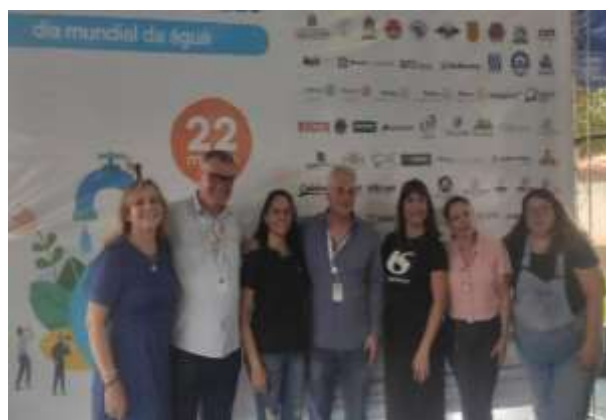
Participantes reunidos com o Superintendente da Sabesp ao centro