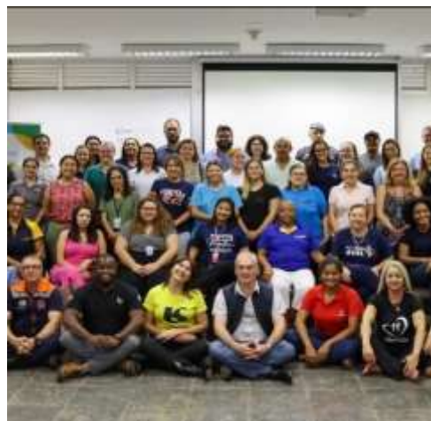
Foto oficial da reunião