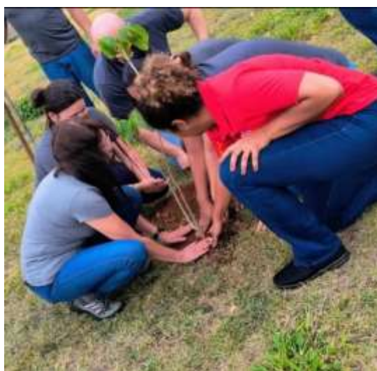
Colaboradores durante o plantio