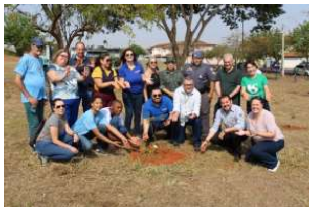
Registro dos participantes na ação